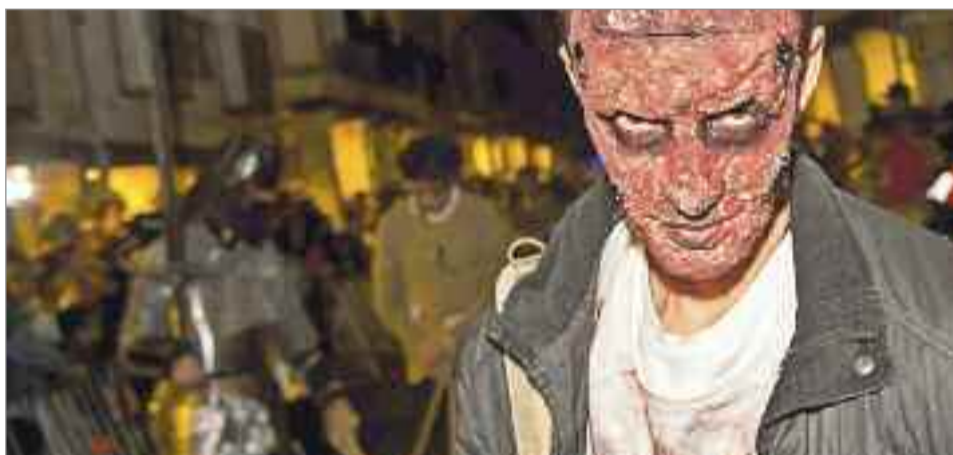
La imaginación brilló durante la celebración en el evento de Alcalá zombie'22

acrobacias, música en directo, lectura del oráculo y hasta una explosión de fuego. Alcalá zombie'22 reunió a cientos de personas para disfrutar de la noche de Halloween en Alcalá de Henares, y contó con una gran participación de entidades, asociaciones y vecinos y vecinas complutenses. Además, en las horas previas al pasacalles Alcalá zombie'22, tuvieron lugar tanto las actividades infantiles con la celebración de talleres de "Cucharas monstruosas" y "Brazaletes peludos", y el Concurso de Calabazas organizado por las Peñas Festivas de la ciudad, que reunió magníficos diseños de decenas de vecinos y vecinas complutenses.