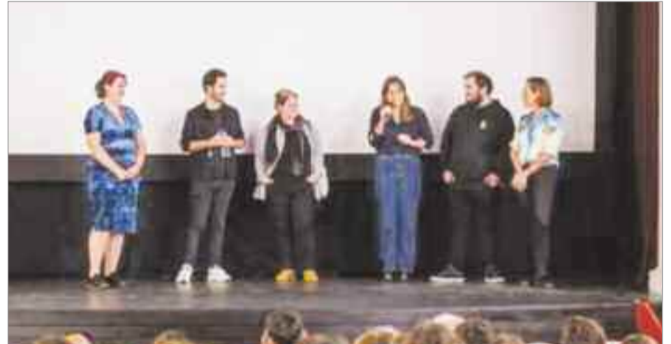
En el Teatro Salón Cervantes y el Corral de Comedias se presentaron las principales piezas