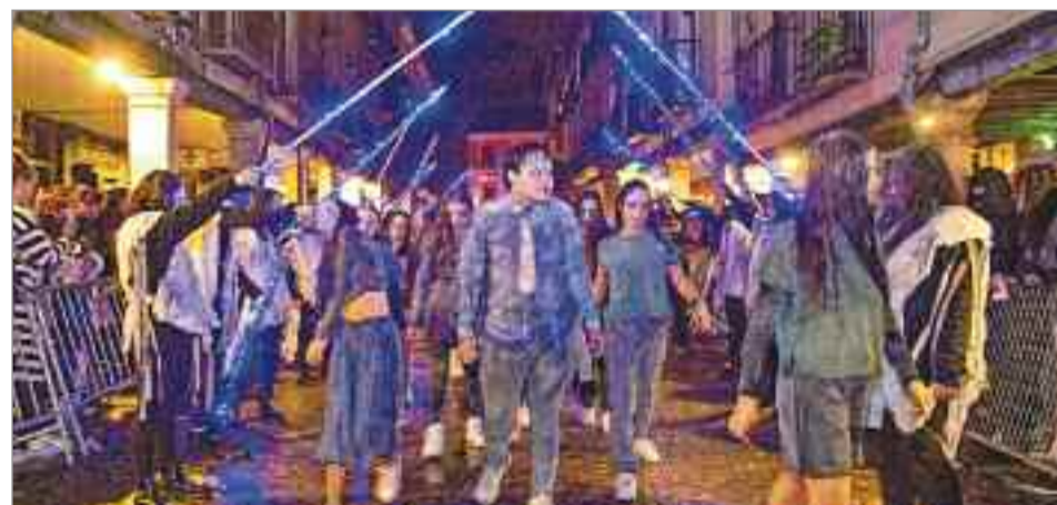
Alcalá zombie'22 reunió a cientos de personas para disfrutar de la noche de Halloween