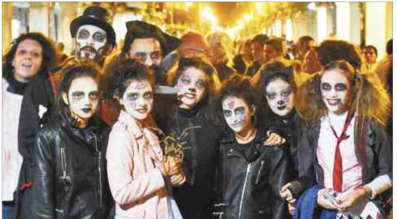
El Casco Histórico acogió AlcaláZombie'22, un movimiento participativo que transformó la Calle Mayor en un pasacalles zombie