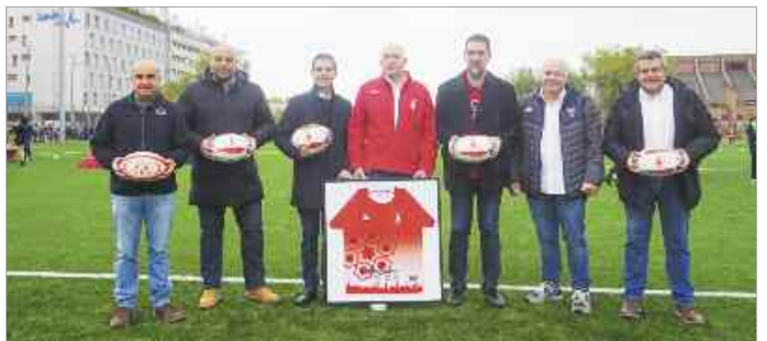
Las actuaciones contaron con una inversión total de 445.987,9 euros (IVA incluido) del presupuesto municipal