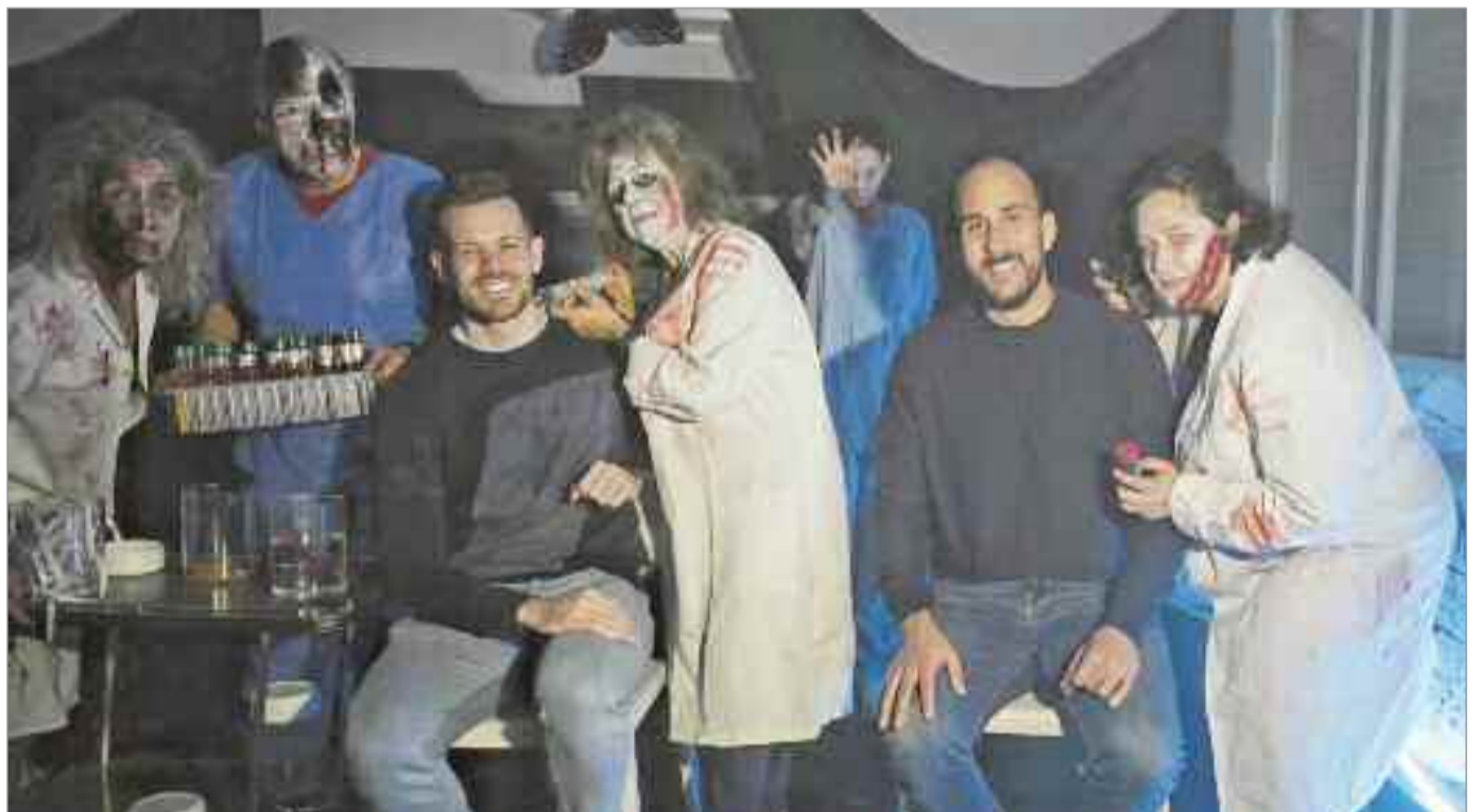
Pasaje del Terror, un Escape Room, actividades de Realidad Virtual, la Pre-sala del desafío, un photocall escalofriante