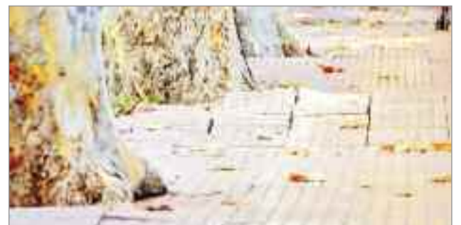
Pese a contar con el visto bueno del pleno, hace un año el PP de Alcalá volvió denunciar la situación ante la queja de los vecinos por la peligrosidad que comportaba transitar por estas calles.