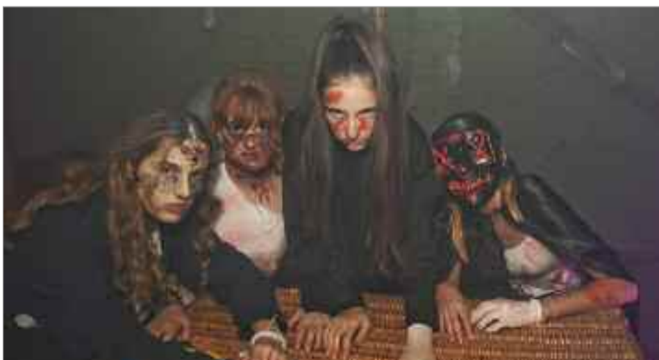
La Plaza de Cervantes se convirtió en el epicentro del terrorífico evento