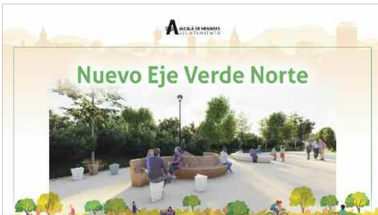
Las principales actuaciones consistirán en la mejora y adecuación de los caminos, para dotarlos de todos los criterios de accesibilidad