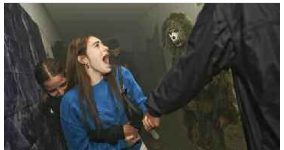
La convocatoria de este movimiento sumó más de 135 protagonistas