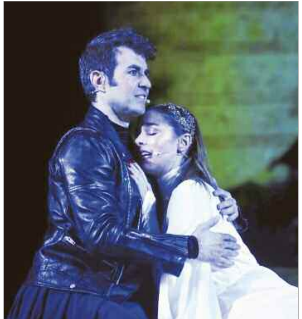
La producción corrió a cargo de SEDA y la dirección fue de Pepa Gamboa