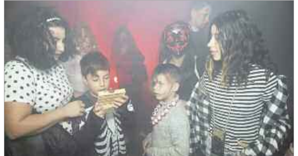
La Casa de la Juventud fue el escenario de numerosas actividades dentro de la programación de Halloween 2022 reuniendo a cientos de jóvenes en un fin de semana muy festivo