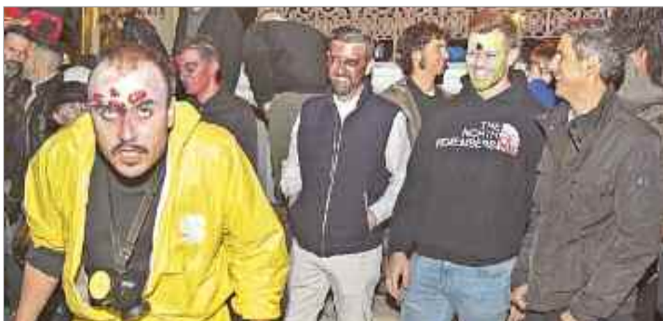
La fiesta contó con una gran participación de entidades, asociaciones y vecinos