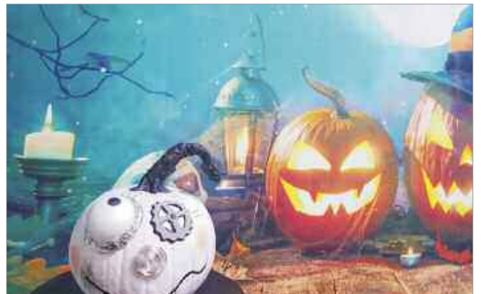
A propuesta de las Peñas de la Ciudad se celebró un concurso de decoración de calabazas

Para incentivar la participación, se establecieron los siguientes premios: un Primer premio de 150 euros, un segundo premio de 100 euros, y 4 menciones especiales, dotadas económicamente con 50 euros cada una.