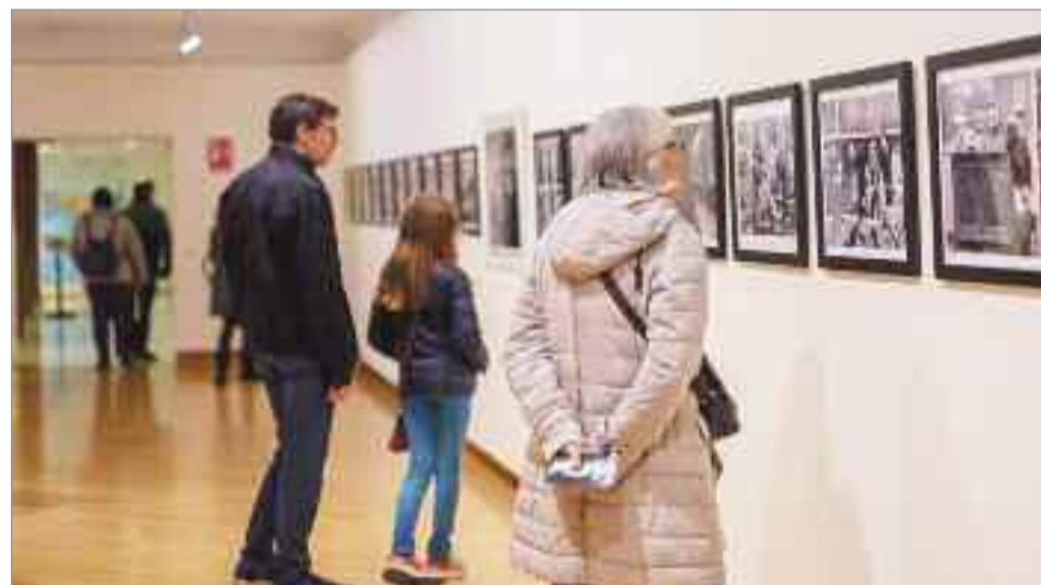
'El placer de mirar' es una propuesta artística basada en fotografías documentales "modo espía"