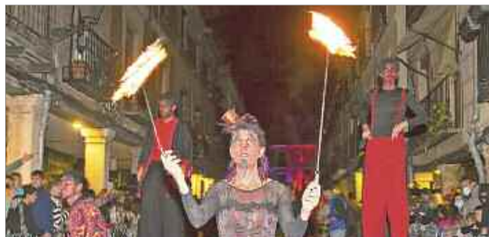
La ciudad de Alcalá de Henares recibió una horda de zombies por sus calles