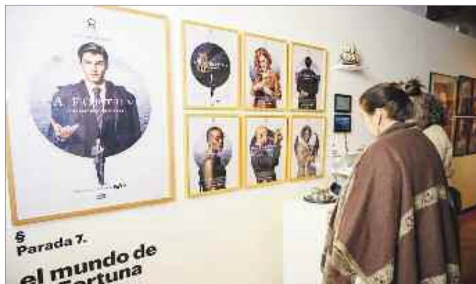
Las muestras estuvieron abiertas al público en el Antiguo Hospital de Santa María La Rica

Urbizu, 'Tiempo después' de José Luis Cuerda; la divertidísima 'Justo antes de Cristo' de Montero y Maidagán; o la especial 'Vida perfecta' de Leticia Dolera.