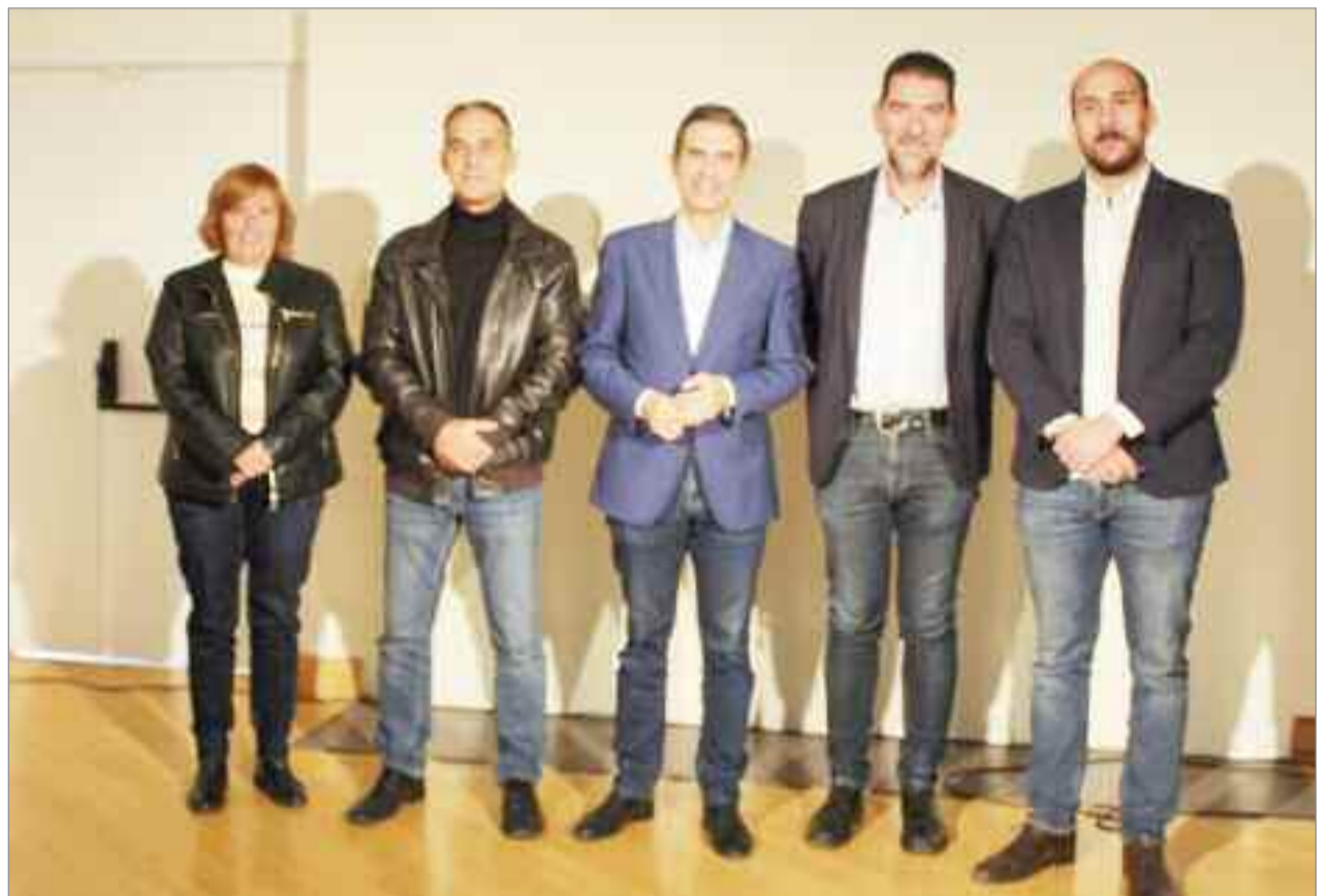
El proyecto cuenta con una inversión de 1.469.896,88 euros de fondos municipales y un plazo de ejecución de 4 meses

Las principales actuaciones consistirán en la mejora y adecuación de los caminos, para dotarlos de todos los criterios de accesibilidad, la instalación de nuevo